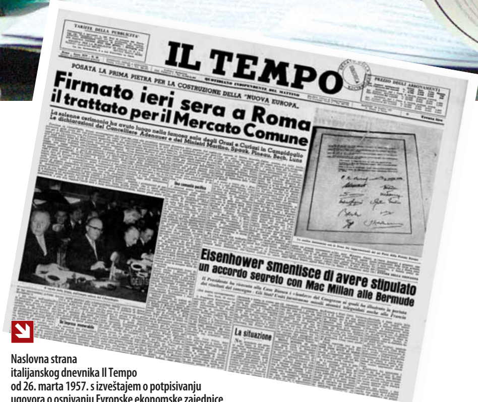
Naslovna strana italijanskog dnevnika Il Tempo od 26. marta 1957. s izveštajem o potpisivanju ugovora o osnivanju Evropske ekonomske zajednice

U specijalnom dodatku o godišnjici potpisivanja Rimskih ugovora govore i pišu